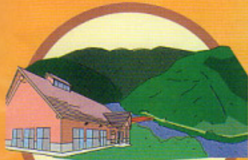
備中湖の大パノラマが広がる 西山高原