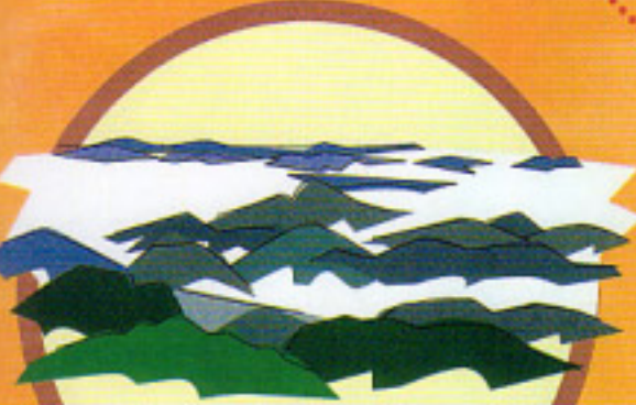
秋から冬にかけて見られる 弥高山の雲海