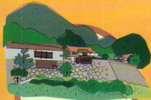
横溝正史の「八つ墓村」の ロケ地として有名な 広兼邸