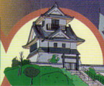
すっぽんの化石がある 風と化石の館