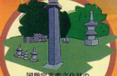
国指定重要文化財の 保月の六面石幢