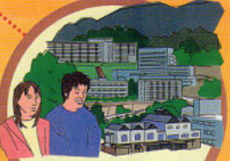
活発な公開講座などで知られる 吉備国際大学