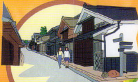
ベンガラ格子に石州瓦の 家並みが続く 吹屋ふるさと村