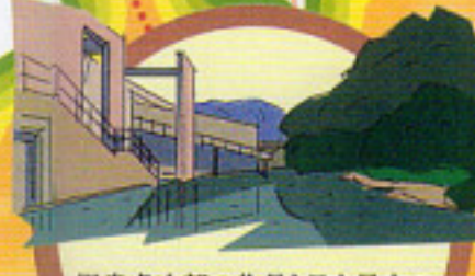
児島虎次郎の作品と日本最古の 植物化石を展示する 成羽町美術館