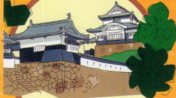
日本一高いところにある 備中松山城