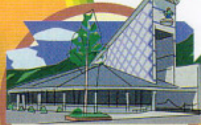
富永一朗氏の原画が見られる 吉備川上ふれあい 漫画美術館